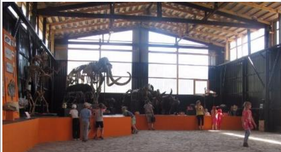
Фото 1. Выставочный зал