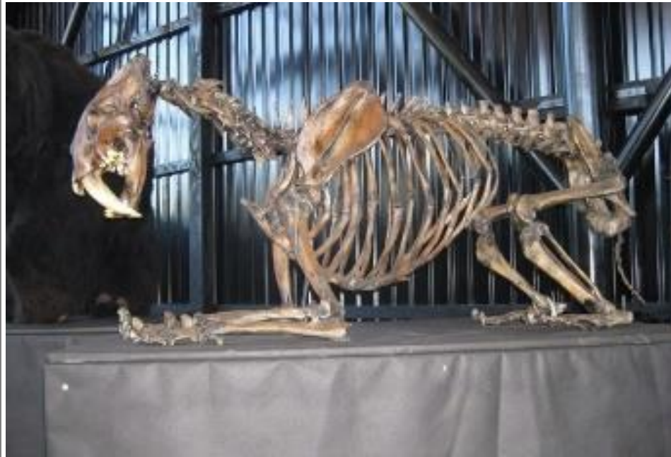
Фото 3. Древние ископаемые Палеопарка