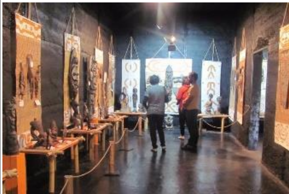
Фото 2. Экспонаты Палеопарка