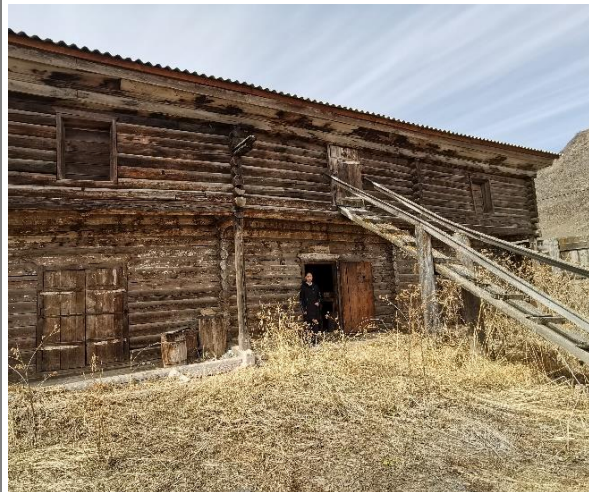
Фото 1. Амбары Аргымая Кульджина начала XX века