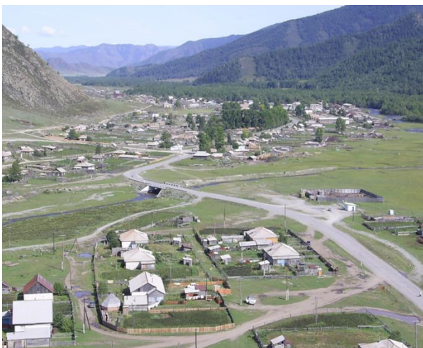
Фото 2. Теньга с птичьего полета