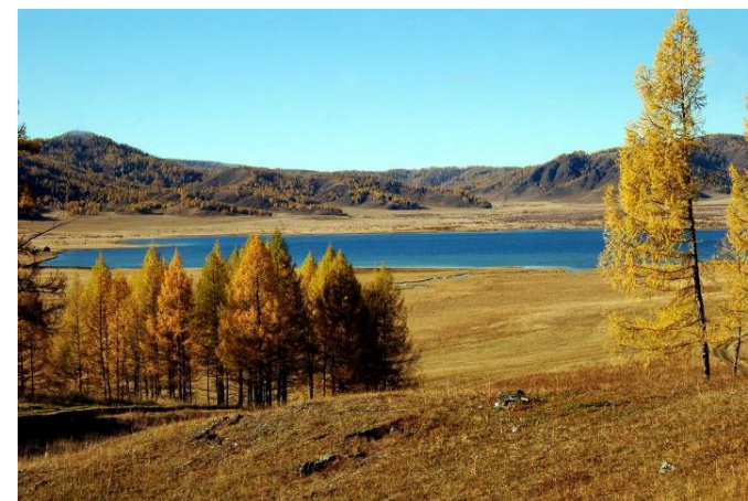
Фото 3. Теньгинское озеро