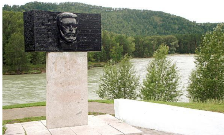
Памятник В.Я. Шишкову на Чуйском тракте