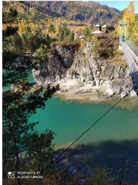
Храм Иоанна Богослова на острове Патмос