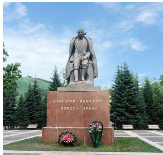
7. Сквер Г.И. Чорос-Гуркина