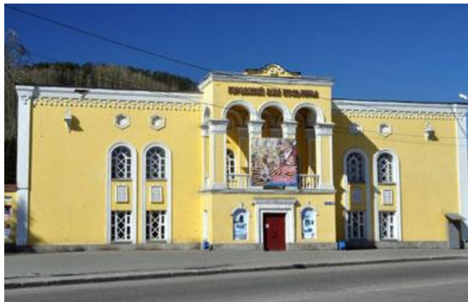
5. Дом культуры