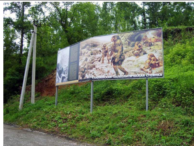
1. Улалинская палеолитическая стоянка