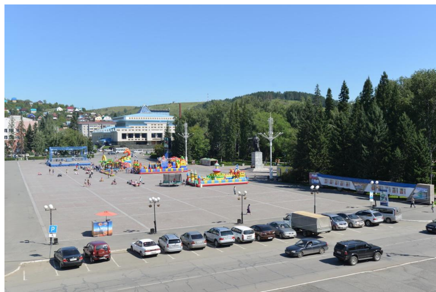
8. Площадь Ленина