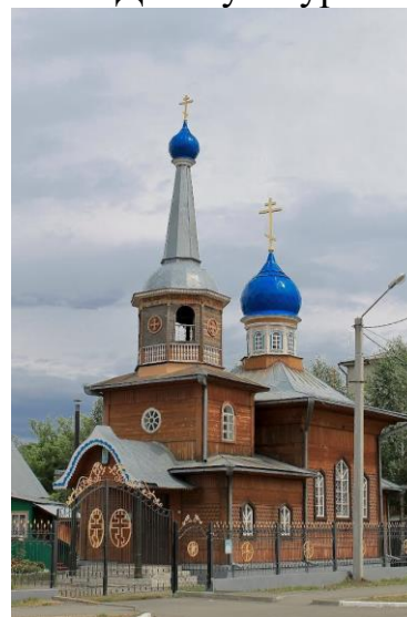
6. Церковь Покрова Пресвятой Богородицы