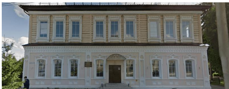
4. Церковно-приходская школа